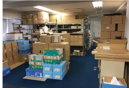
BB や 12&12 など出版物保管場所はこんな感じで所狭しと並んでいます

常任理事会構成メンバーはA類常任理事2名(ノンアルコール)、B類常任理事6名(アルコール)、WSM評議員2名、JSO職員3名(2024年7月から12月は所長不在のため2名)の計13名で構成されていて、この13名で企画、評議会、JSO、BOX916、広報・病院施設、矯正、出版、国際協力、財務を分担して評議会で報告になったことを実行しています。